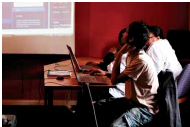
Suomi rahoittaa laajaa tieto- ja viestintäteknologiaohjelmaa (SAFIPA) Etelä-Afrikassa. Kapkaupungissa toimiva RLabs on kehittänyt JamiiX-yhteisöalustan, jota käytetään erilaisten neuvontapalvelujen taustalla. Sillä on Etelä-Afrikassa yli 250 000 käyttäjää. Palvelun teknologiaa kaupallistetaan SAFIPAn rahoittamana.

Kehityspoliittisen toimikunnan mielestä vähimmäisedellytys, jolla kansainväliset köyhyyden vähentämisen tavoitteet voidaan saavuttaa, on kehitys yhteistyön rahoituksen nostaminen 0,7 prosenttiin bruttokansantulosta vuonna 2015. Tämä on mahdollista, jos vuosittaisia määrärahoja nostetaan tasaisesti myös tulevina vuosina. Kehitys yhteistyön kasvattamisen ohella ilmastomuutoksen torjuntaan ja muutosten kielteisiin vaikutuksiin sopeutumiseen tarvitaan sekä teollisuus- että