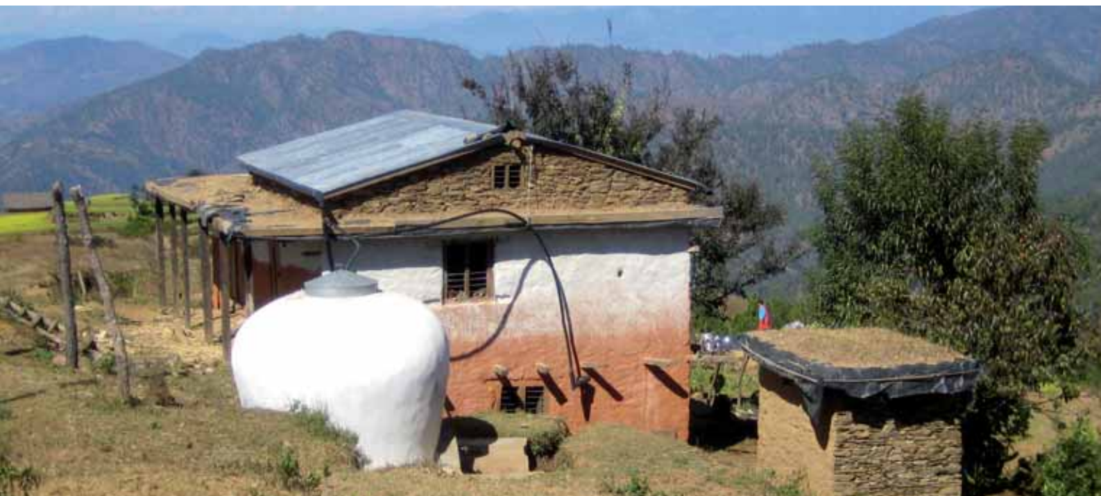
Suomalaisella tuella rakennettu sadevedenkeruujärjestelmä Dailekhin alueella Nepalin keskilännessä. Järjestelmä on kehitetty Nepalissa suomalaisessa hankkeessa 1990-luvun lopussa.

Vuoden 2009 vuosiarviossaan kehityspoliittinen toimikunta esitti huolensa siitä, että suomalaisen lisäarvon kapea tulkitseminen voi johtaa avun lisääntyvään tosiasialiseen sitomiseen Suomesta tehtäviin hankintoihin ja sitä kautta avun kustannustehokkuuden mahdolliseen laskuun. Jos kukin avunantaja yrittää sitoa hankintojen tekemisen omaan maahansa, se vaikeuttaa avunantajien välistä yhteistyötä ja ennen muuta heikentää vastaanottajien omistajuutta ja vastuuta omasta kehityspoliitikastaan. Nämä uhat nostetaan esille DAC:n pari vuotta sitten julkaisemassa evaluaatiossa, joka