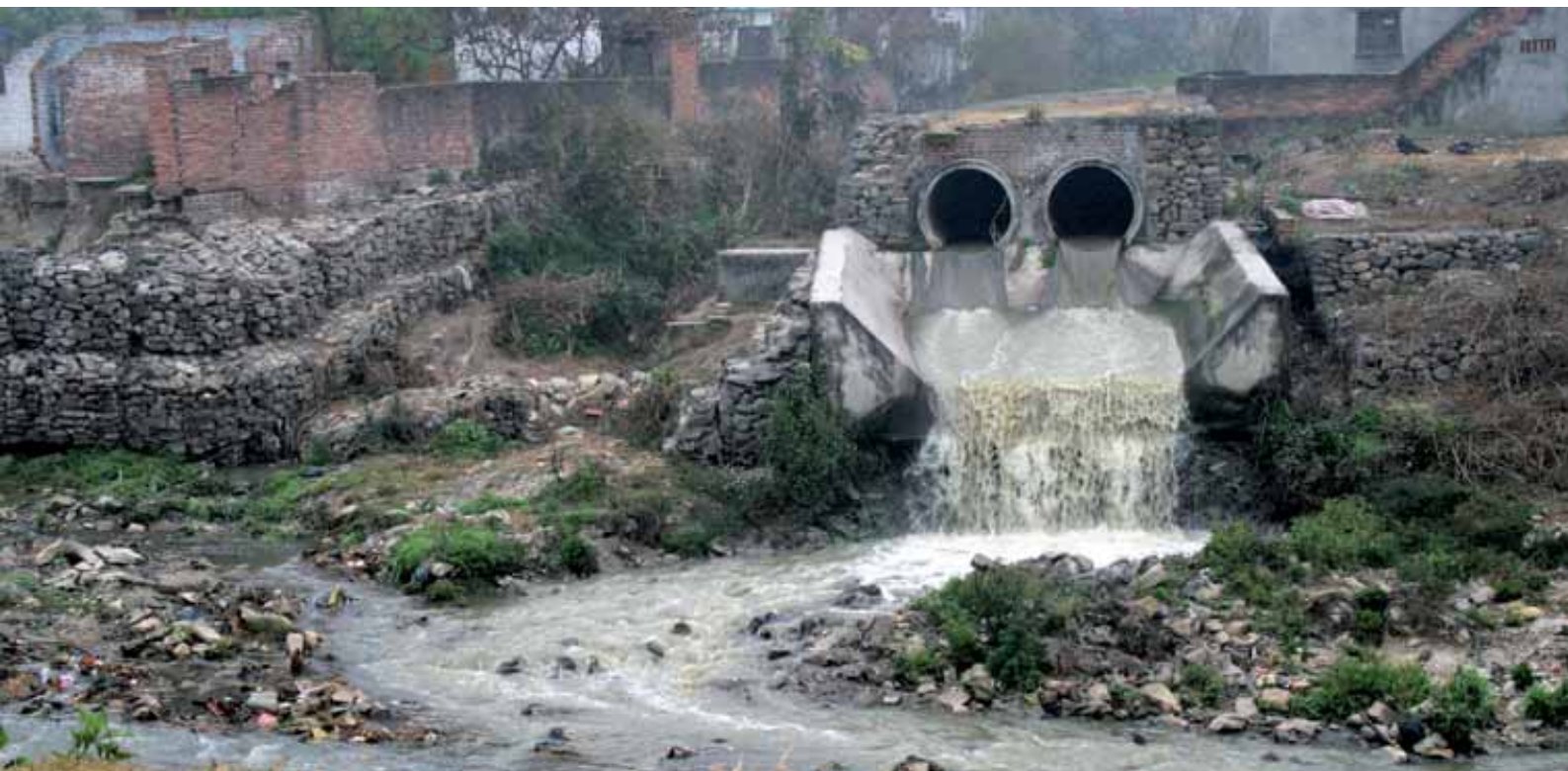
Viemäreistä virtaa likavettä pyhään Bagmati-jokeen Pashupatinahin temppelin lähellä Katmandussa. Puhtaan juomaveden saannissa ja jätevesien puhdistuksessa on merkittäviä puutteita kehitysmaissa.

simman suuret. Tämän lisäksi toimintaympäristön ja vastaanottajamaiden tuntemus ovat kehitysyhteistyön tuloksellisuuden perusedellytyksiä. Tästä syystä apua tulee edelleen keskittää tärkeimpiin kumppanimaihin ja välttää sen maantieteellistä hajaannuttamista. Jotta avun pirstoutuminen voidaan ehkäistä, Suomen ei tule toimia yhdessä vastaanottajamaassa kovin monella sektorilla. Valintoja pitää tehdä kehitysmaiden tarpeiden mukaan.