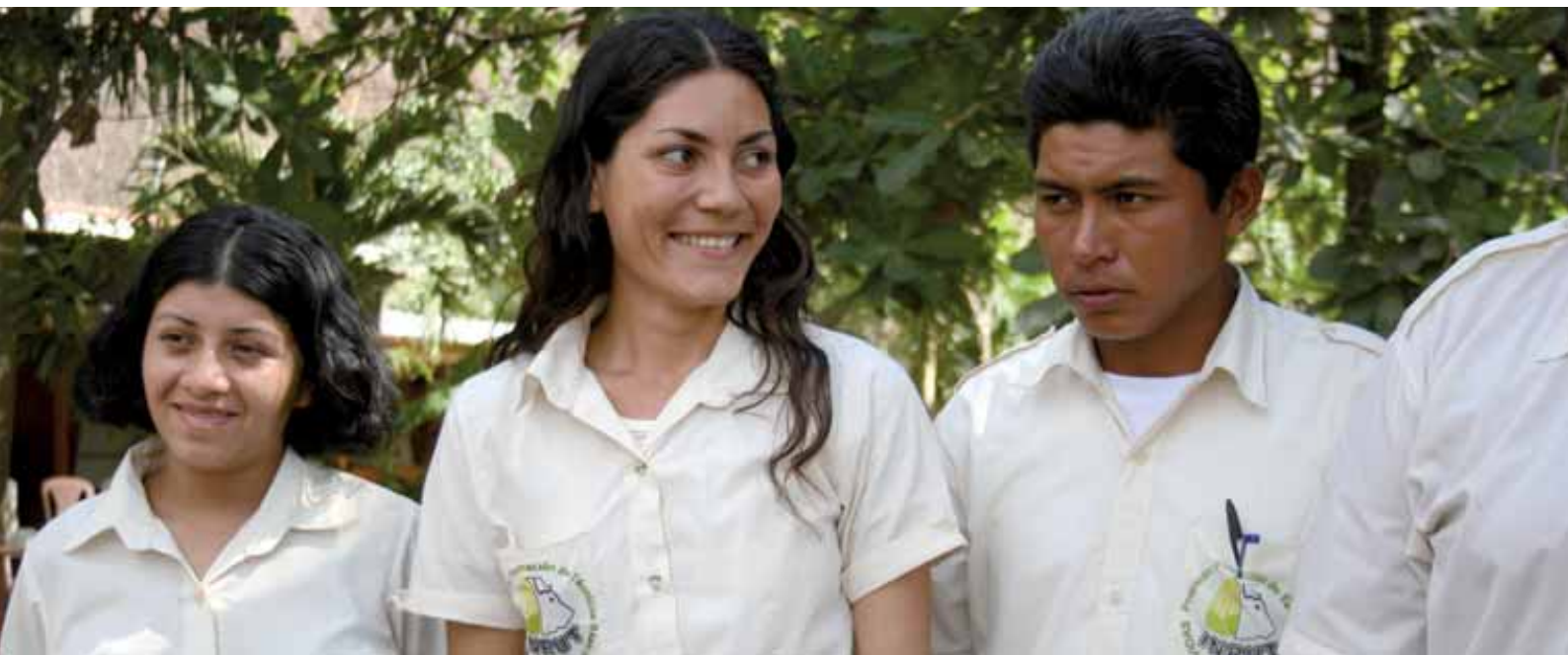
Osana Suomen rahoittamaa Fomevidas-ohjelmaa nuoria on koulutettu maataloustuotannon asiantuntijoiksi ja neurojiksi Nicaraguassa.

set koulutusohjelmat kohdistuvat koulunsa aloittavista lapsista aina aikuisiän kynnyksellä oleviin nuoriin. Painopiste on kuitenkin ollut alemman asteen peruskoulutuksessa.