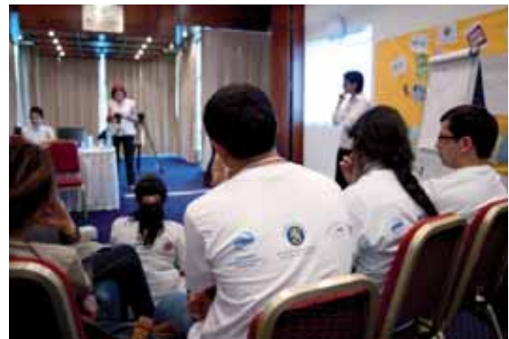
Suomi tukee osana laajemman Euroopan aloitetta Youth Bank -ohjelmaa. Nuoria Armeniasta, Georgiasta ja Azerbaidzhanista koulutustilaisuudessa Tbilisissä.

Toinen uudenlainen hankekokonaisuus on ympäristö- ja turvallisuusaloite ENVSEC (Environment and Security), joka kohdentuu konfliktialueiden ja rajat ylittävien luonnonvarojen hallinnon ja kestävän kehittämisen edistämiseen sekä suurten kaupunkien nopeasta väestökasvusta aiheutuvien ongelmien minimointiin. Läpileikkaavana teemana on yleisen ympäristötietoisuuden lisääminen, ympäristöyhteistyön aikaansaaminen ja tiedotusvälineiden rohkaiseminen tiedotuksen lisäämiseksi ympäristöhaitoista. Aloite yhdistää merkittävällä tavalla sekä konfliktien että ympäristötuhojen ennaltaehkäisyyn tähtääviä toimia.