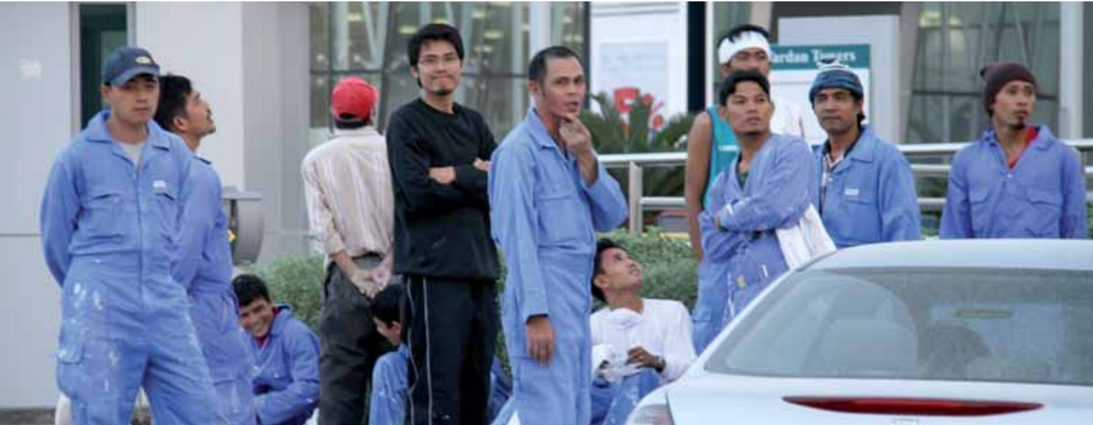
Doha, Qatar. Siirtolaisten rahalähetykset Etelä-Aasiaan kasvoivat vuonna 2009. Yksi syy tähän on se, että paljon etelä-aasialaisia työskentelee Persianlahden öljymaissa, joiden taloutta kriisi koetteli muita alueita hienovaraisemmin.

rahälähetyksen määrä sen sijaan kasvoi vuonna 2009. Yksi syy tähän on, että paljon Intian, Bangladeshin ja Pakistanin kansalaisia työskentelee Persianlahden öljymaissa, joiden taloutta kriisi koetteli muita alueita hienovaraisemmin. Sen sijaan Keski-Aasian tasavalloissa sekä Pohjois-Afrikassa ja Lähi-idässä rahälähetyksen määrä väheni odotettua enemmän. Ensiksi mainittu alue joutui kärsimään Venäjän talouden syvästä notkahduksesta, kun taas jälkimmäisiltä alueilta lähteneiden siirtotyöläisten ansioihin vaikuttivat muun muassa Espanjan, Italian ja Kreikan talousvaikeudet. 31