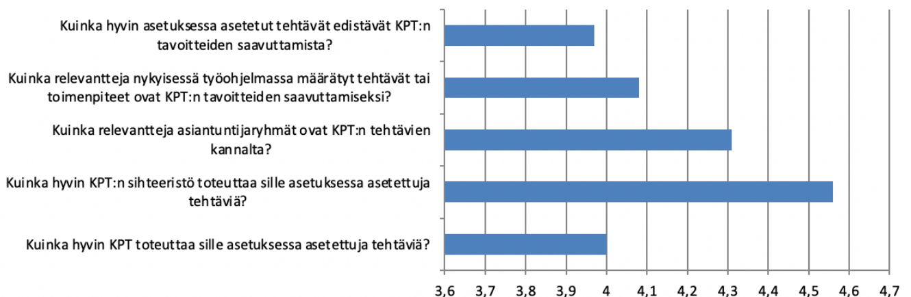
Kuvio 2. Vastaajien arviot asteikolla 1-5 KPT:n tehtävien ja toiminnan relevanssista sekä sille asetettujen tehtävien hoidosta (1=erittäin huonosti, 5=erittäin hyvin, n=42).

Kuviossa 2 alla on kuvattu vastaukset kysymyksiin, kuinka KPT on suoriutunut sille asetetuista tehtävistä. Vastaukset toimikunnan tehtävien relevanssista, tyytyväisyydestä hoidettuihin tehtäviin ja sihteeristön roolista olivat erittäin myönteisiä. Näissä kaikissa kysymyksissä vastausten keskiarvo (asteikolla 1–5, jossa 1=erittäin huonosti ja 5=erittäin hyvin) oli 4 tai yli. Parhaat arviot sai KPT:n sihteeristön kyky toteuttaa sille asetetut tehtävät (keskiarvo = 4,56). Tätä voidaan pitää erinomaisena suorituskykyä koskevana arviona. Ainoa vastaajien keskuudessa noussut tyytymättömyyden aihe liittyi resurssien niukkuuteen suhteessa tehtävien laajuuteen sekä Agenda 2030 -ohjelman mukaisen kehityspolitiikan edistämiseen ja Suomen kestäväen kehityksen tavoitteiden saavuttamiseen kokonaisvaltaisesti. Osa vastaajista nosti esiin avokysymyksissä, että kehityspolitiikan vaikuttavuuden vahvistaminen edellyttäisi KPT:ssa laajempaa kestäväen kehityksen tavoitteet huomioivaa toimintaa.